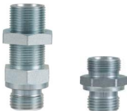
Schottadapter / Einschraubstutzen Bulkhead adapter / male stud coupling Seite / page 139 - 141

D1 (mm) Durchmesser / Diameter R1 Rohrgröße / Pipe size G1 Gewinde / Thread